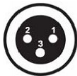
DMX – выход панельный разъем XLR «мама»