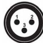
DMX – вход панельный разъем XLR «папа»